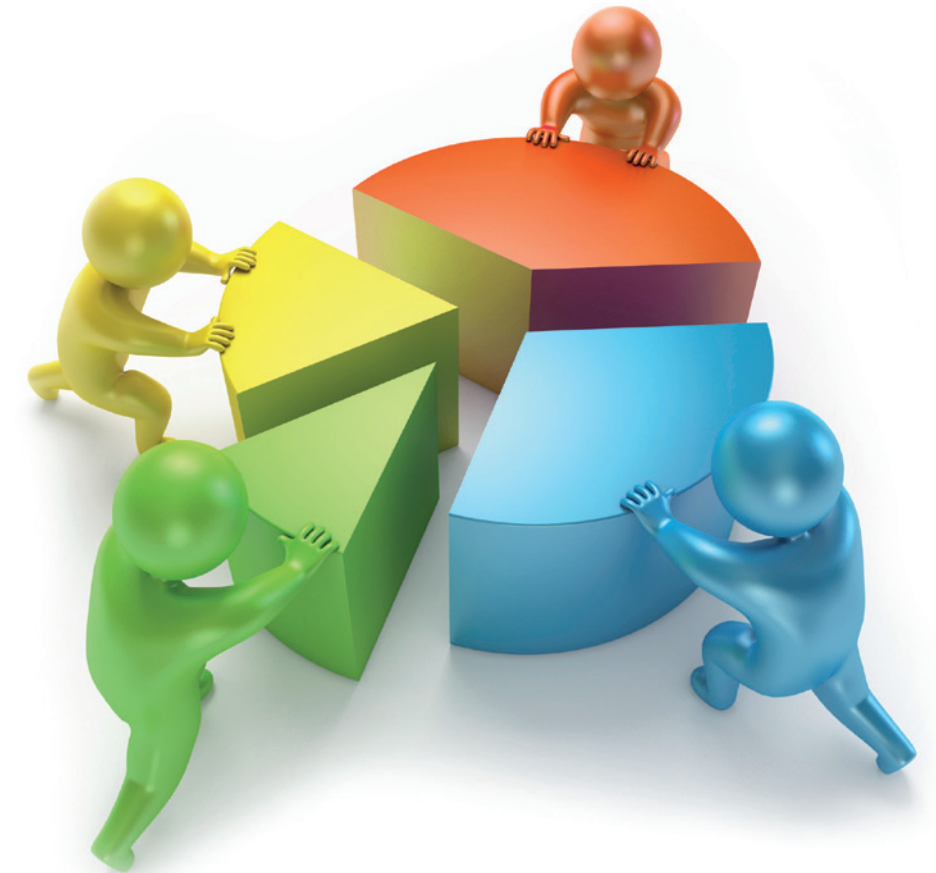
CCI Moselle / Service Communication.

sur le site des Usines CLAAS France à St. Rémy / Woippy (57)