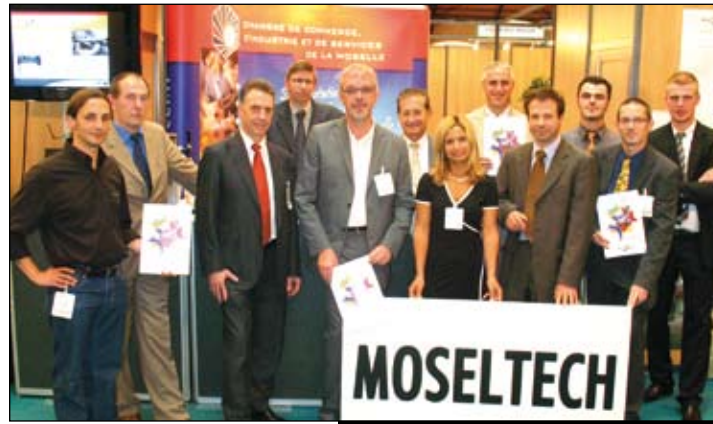
Moseltech au FIST à Strasbourg